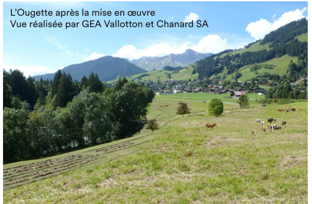
L'Ougette après la mise en œuvre Vue réalisée par GEA Vallotton et Chanard SA